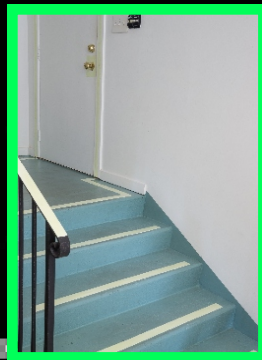
Beschichten - Night Star