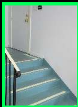
Coating aanbrengen - Night Star