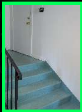
Préparer le fond