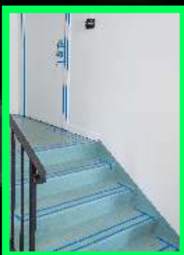
Coller le fond